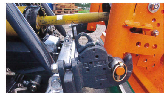
Geräteaufnahme der Kategorie 1 - Standardsystem zum Anbau Ihrer vorhandenen Anbaugeräte.