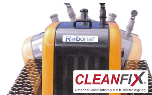
Der Yanmar Diesel Motor mit Cleanfix Wendelüfter, schwenkt automatisch entsprechend der aktuellen Hanglage.