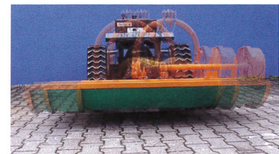
40 cm Seitenverschiebung zum echten randnahen Arbeiten an Zäunen, Treppen und Mauern.