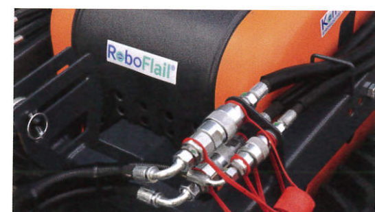
Extra groß dimensionierte Hydraulikschläuche und Verbindung dienen der thermischen Optimierung.