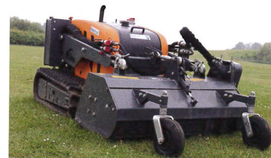
Kompakt und dennoch stark, mit reversierbarer Drehrichtung vom Mulcher.