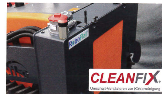
Ein großer Kühler, ausgestattet mit dem Cleanfixsystem, sorgt für ausreichende Kühlung auch an heißen Tagen.