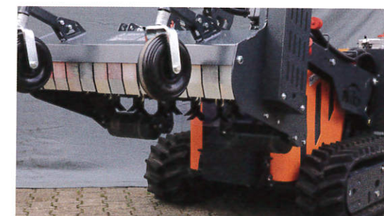
Dank weitem Ausheben ist der Böschungswinkel maximiert; für problemloses Einfahren in den Hang oder in Gräben.